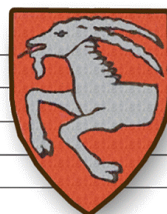
Gesangverein Weende von 1863